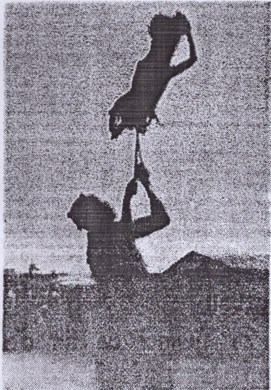
Un jongleur de conteau exécutant un tour d'adresse

Après la ville de Macenta, nous avons pu également admiré d'autres danses, écouté d'autres chansons, et vu tout ce qui est caractéris-