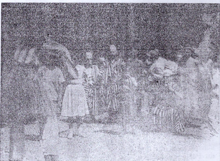
Les touristes en tenue nationale avec les artistes.

«Nous sommes très contents de faire ce magnifique voyage à travers la Guinée-Forestière qui nous a beaucoup impressionné nous a confié un second touriste ; nous avons visité la capitale de la Guinée-Forestière, la ville de N'Zérékoré et nous avons vu de merveilleuses unités industrielles et agricoles, en particulier la scierie de N'Zérékoré. Ensuite nous avons vu le Mont-Nimba qui est plein d'attractions surtout pour le touriste et aussi