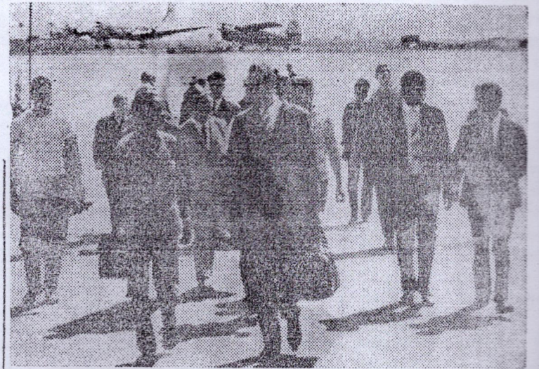
Sur notre photo, la délégation des boxeurs allemands à leur arrivée vendredi, à l'aéroport international de Gbessia

on le sait se produiront ainsi pour la première fois dans notre pays, comptent dans leur rang de grands champions dont certains sont détenteurs de titre européen.